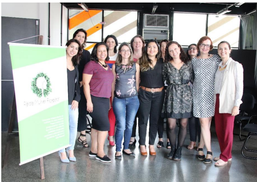
Participantes da Assembleia de Fundação da Rede (2018)