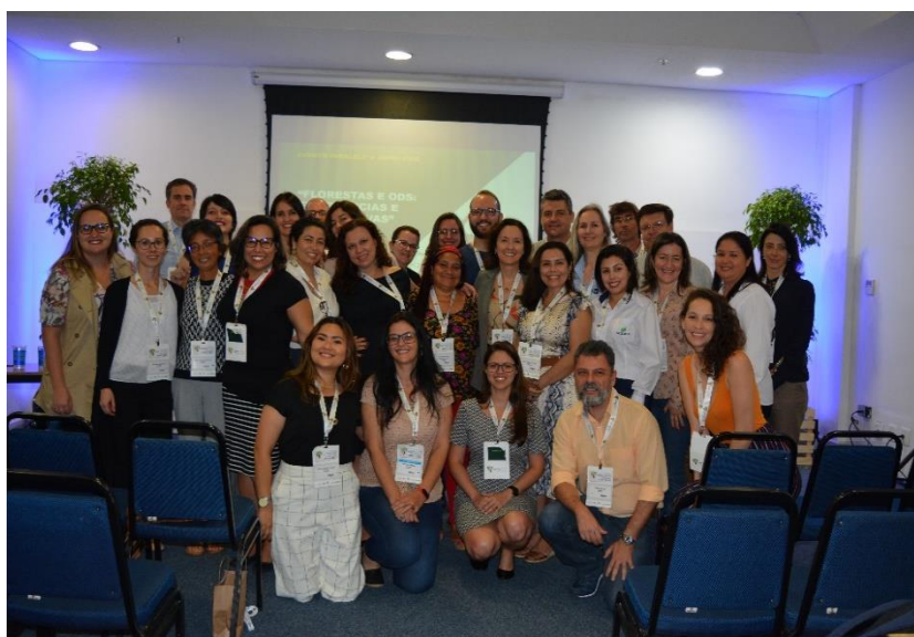
Participantes do evento paralelo promovido no IUFRO (2019)