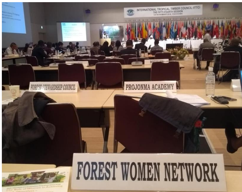
Participação da Rede Mulher Florestal na reunião da OIMT (2018)