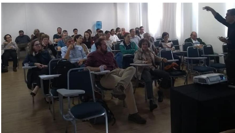
Reunião do Diálogo Florestal (2019)