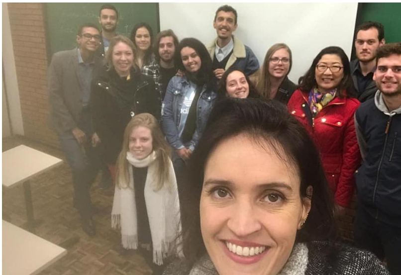
Participação no Ciclo de Palestras da PUC-PR (2019)