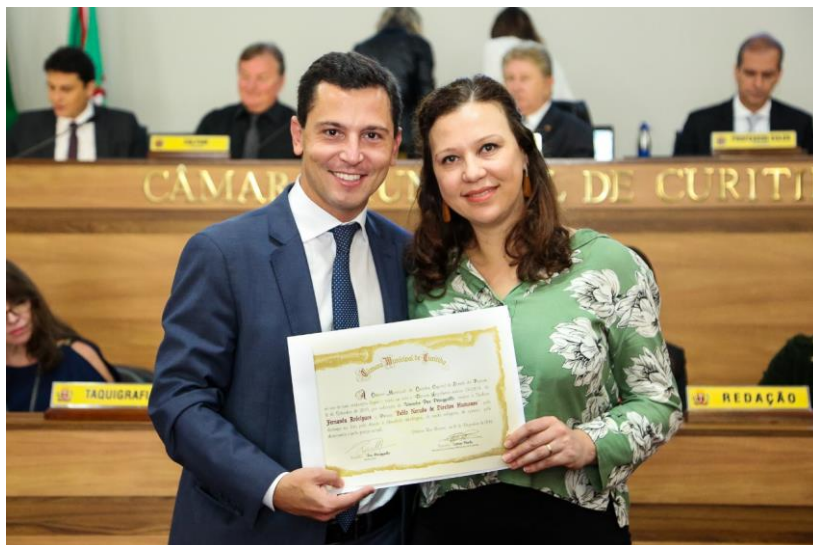
Prêmio Pablo Neruda de Direitos Humanos (2019)