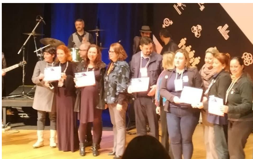
Prêmio ODS Sesi PR (2019)