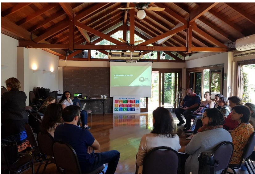
Primeira Assembleia da Rede (2019)