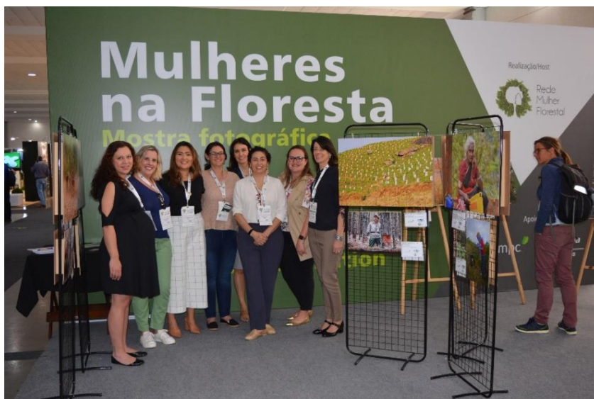
Mostra fotográfica “Mulheres na Floresta” no IUFRO (2019)