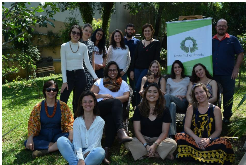
Primeira Assembleia da Rede (2019)