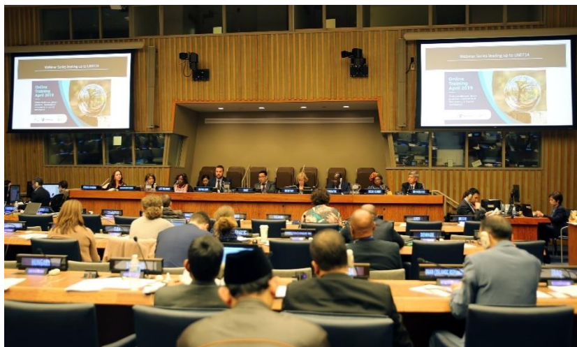
Foro das Nações Unidas sobre Florestas