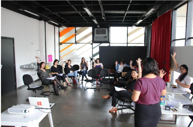
Assembleia de Fundação da Rede (2018)