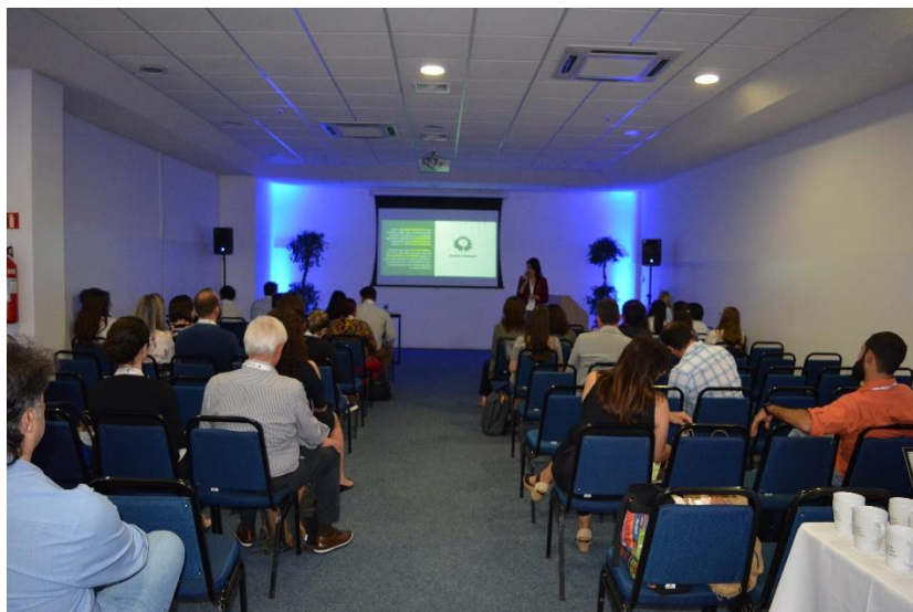
Participantes do evento paralelo promovido no IUFRO (2019)