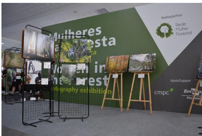
Mostra fotográfica “Mulheres na Floresta” no IUFRO (2019)