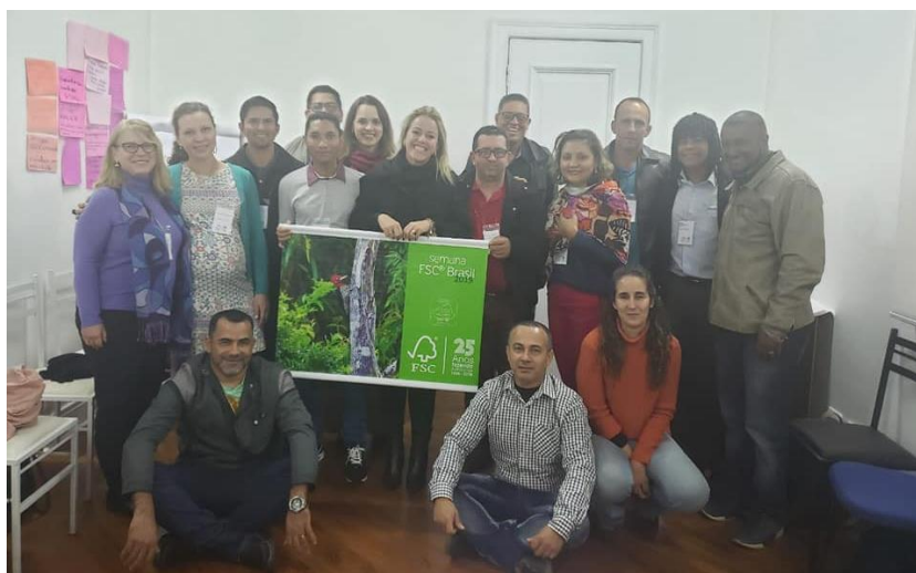
Reunião da Câmara Social do FSC Brasil (2019)